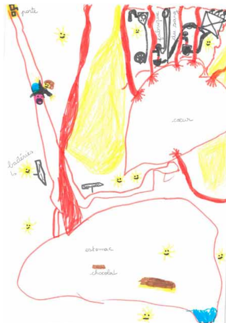
Dessin d'un enfant de CE1 lors d'un Rituel corporel à Rixheim

Je peux annoter mon dessin, le compléter avec des mots et/ou écrire le récit du voyage au dos de ma feuille.