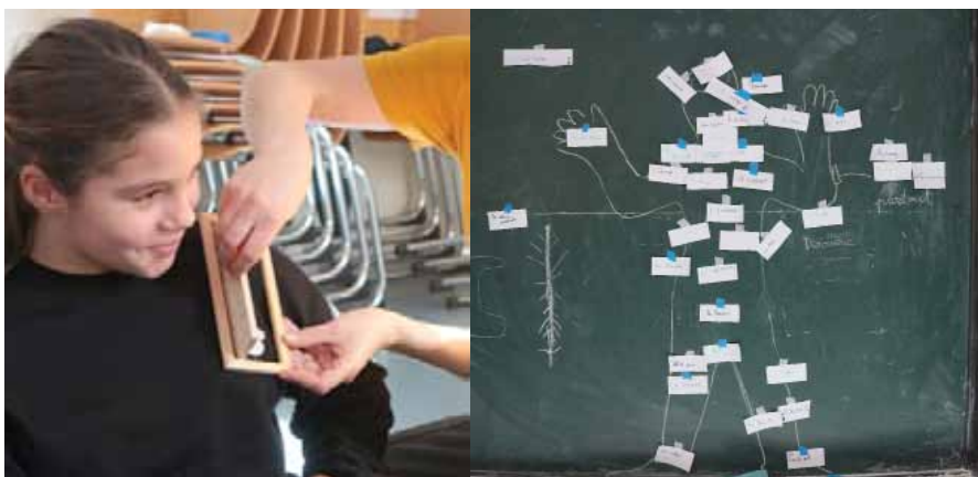
Rituels corporels avec une classe de CM2 de Schiltigheim

Un voyage quotidien au plus profond de nous-mêmes.